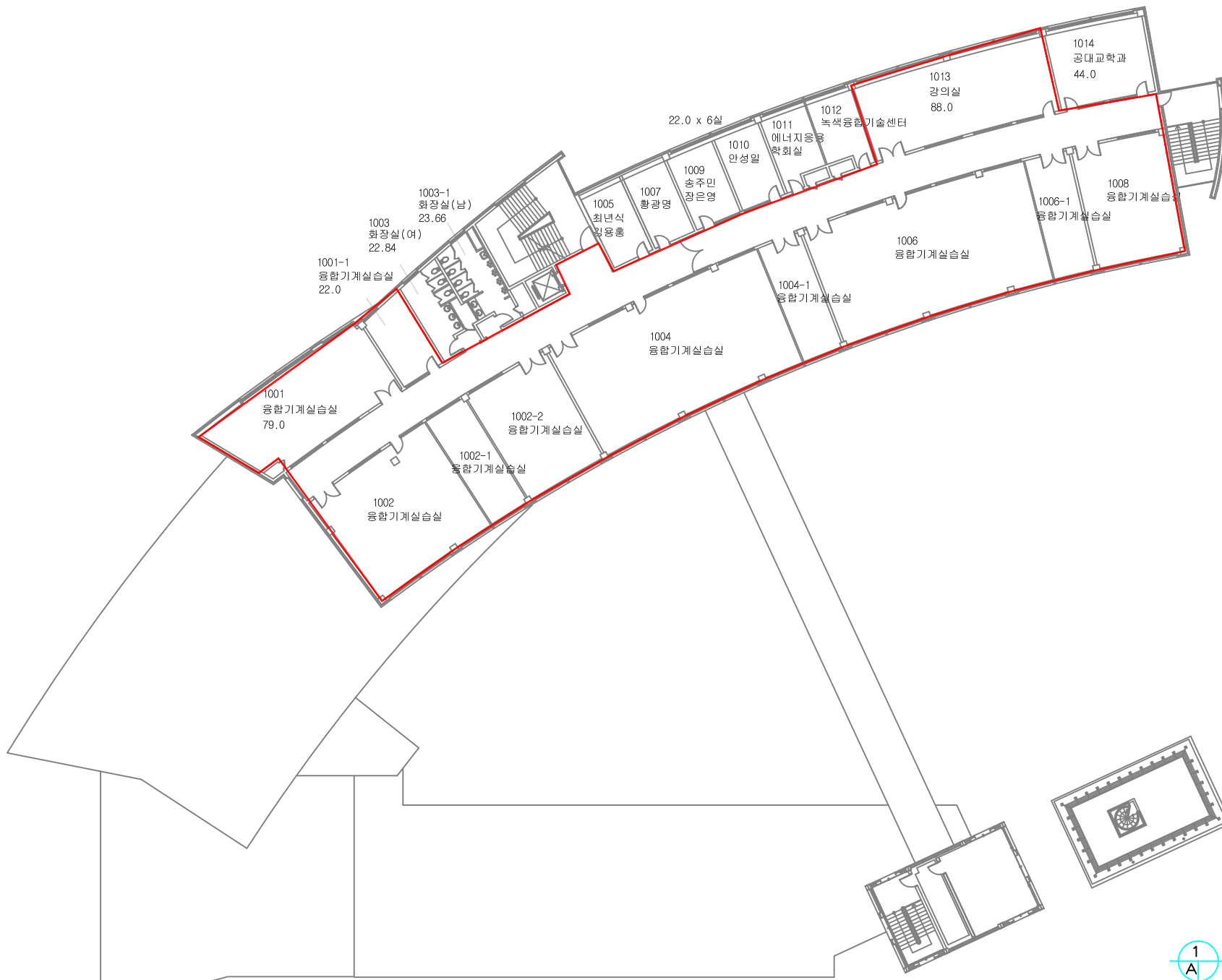
(기존) 1 A 공학관 지상10층 평면도 축척 A3:1 / 300